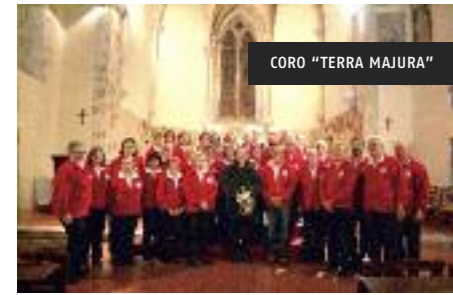
CORO "TERRA MAJURA"

ore 16.00 Coro Terra Majura della sezione CAI Terni