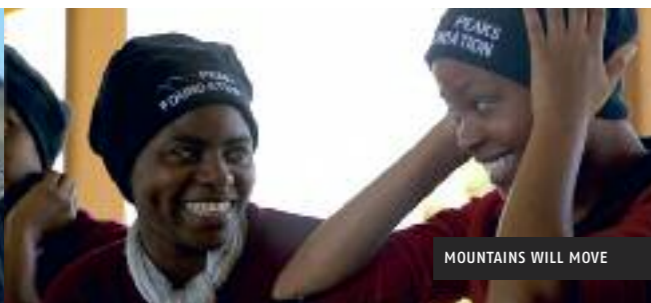
MOUNTAINS WILL MOVE