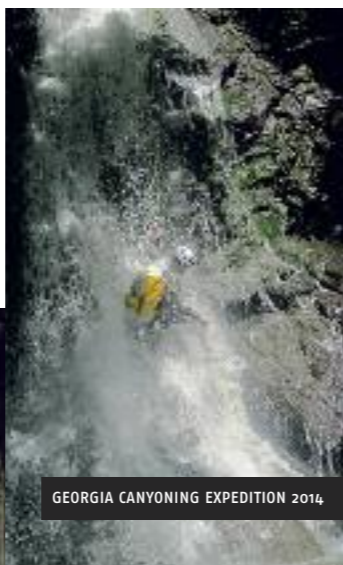
GEORGIA CANYONING EXPEDITION 2014