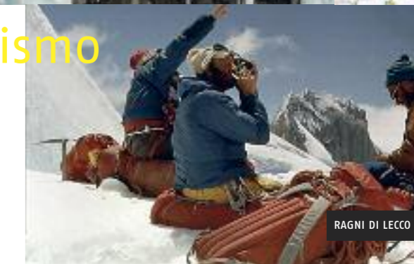
RAGNI DI LECCO